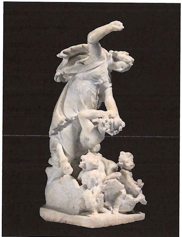
Pietro Bernini, Allegoria della Virtù