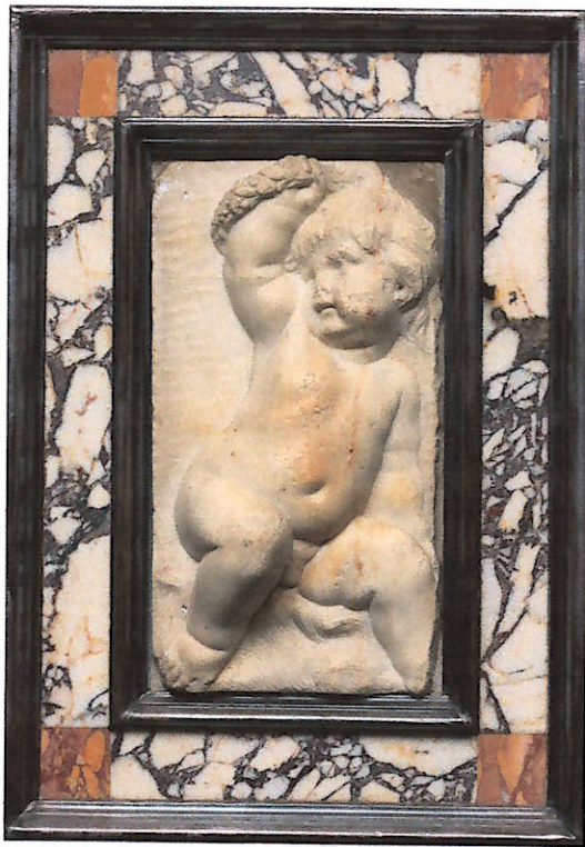
F. Duquesnoy, Putto con corona