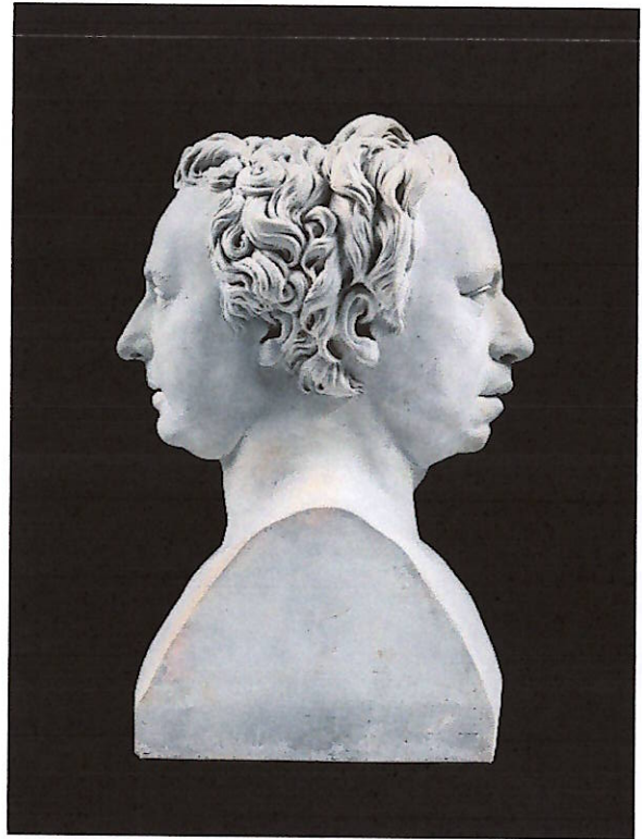
G. Volpato, Erma con i ritratti di Mengs e De Azara